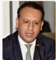
ذ. هشام ملاطي مدير الشؤون الجنائية والعفو ورصد الجريمة