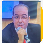
ذ. يونس المراكشي رئيس كتابة الضبط بمحكمة النقض