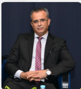
ذ. المدفر الأشقر المدير الإقليمي للعدل بطنجة

فضاء OLM السويسي، شارع الإمام مالك، الرباط