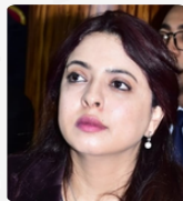
ذة. نسرين الجاوي المديرة الإقليمية للعدل بالرباط